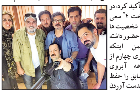
پایتخت ۴ کلید خورد

هستم و به همراه محسن تنابنده مرتب سیناریس ها را با یکدیگر چک می کنیم. الوند همچنین خاطر نشان کرد: فکر می کنم تا آخر ماه مبارک رمضان و پایان پخش "پایتخت ۴" مشغول نگارش سریال باشیم؛ چرا که با تغییر فضای کار و اضافه شدن قسمت ها قطعاً کارمان سخت تر خواهد شد. وی درباره ی حفظ شخصیت های اصلی در "پایتخت ۴" تأکید کرد: در داستان "پایتخت ۴" سعی می کنیم همه شخصیت ها حفظ شوند و حضور داشته باشند؛ ضمن اینکه امیدواریم سری چهارم از این مجموعه آبروی قسمت های سابق را حفظ کند. به نظرم بدست آوردن