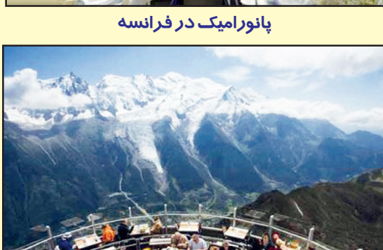
پانورامیک در فرانسه