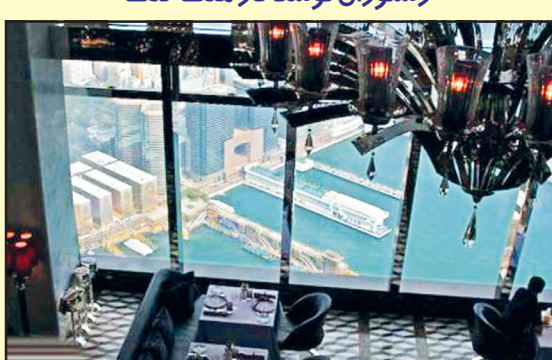
رستوران توسکا در هنگ کنگ