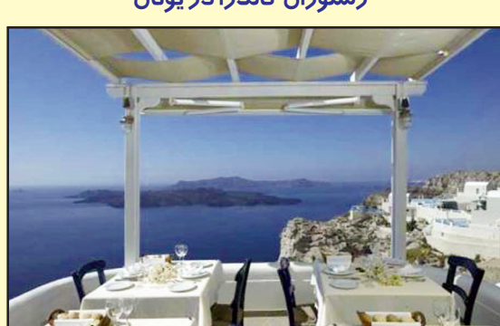
رستوران کالدرا در یونان