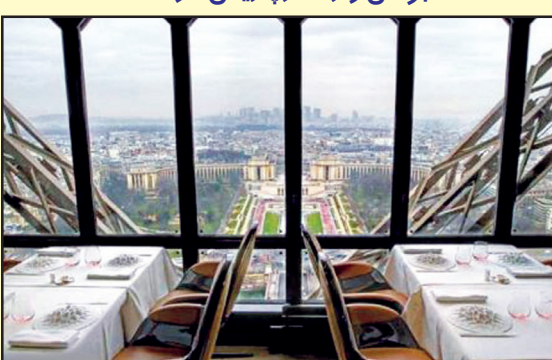
جولس واران در پاریس فرانسه