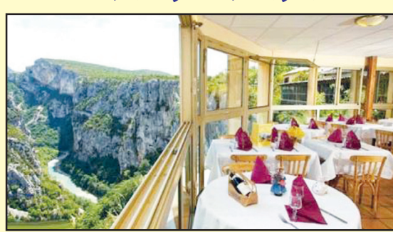
رستوران گرند کاپوین در فرانسه

مطلوبیت خوراکی را به شده، چیدمان مناسب و پاکیزگی و تمیزی می تواند در کیفیت رستوران و شهرت آن نقش به سزایی داشته باشد ولی واقعاً هیچ چیز لذت بخش تر از غذا خوردن در رستورانی با چشم انداز زیبا نیست. چشم اندازهایی به جنگل، کوه، دریا و یا نمای کاملی از شهر. در اینجا می خواهیم معروف ترین و زیباترین رستوران های جهان را که از این نظر زیاندار خاص و عام هستند به شما معرفی کنیم.