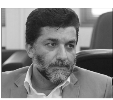
دیگر باید تحلیل گفتمان، نشانه شناسی و پراگماتیک مرور شود.

حج تمتع اعمال شد. حج تمتع الاسلام و المسلمین نیسمی نیز که از طرف حجت الاسلام و المسلمین شریفانی مسئول