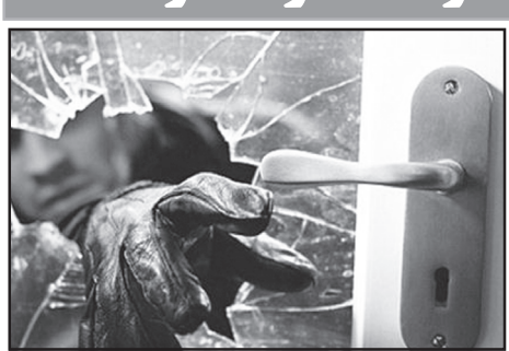
رئیس پلیس آگاهی استان فارس از شناسایی و دستگیری سارق درون خودرو با ۲۴ فقره سرقت خبر داد. سرهنگ «سیروس حیدری» در تشریح جزئیات این خبر گفت: مأموران کلانتری «گلدشت» شیراز یک نفر منتهم را هنگام سرقت درون خودرو مشاهده و وی را دستگیر می نمایند.

وی با بیان اینکه منتهم با تشکیل پرونده جهت ادامه تحقیقات به پلیس آگاهی استان معرفی شد. افزود: در بازجویی صورت گرفته، منتهم به ۲۴ فقره سرقت درون خودرو به وسیله شکستن شیشه خودروها اقرار کرد. رئیس پلیس آگاهی استان فارس گفت: در بازرسی از منزل این فرد دو دستگاه ضبط بخش و تعدادی مدارک هویتی متعلق به افراد مختلف کشف شد. سرهنگ «حیدری» با اشاره به اینکه تعدادی از مالباختگان تا کنون شناسایی و اموال کشف شده به آنها