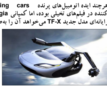
هر چند ایده اتومبیل های پرنده Flying cars موضوعی سرگرم کننده در فیلم های تخیلی بوده، اما کمپانی Terrafugia با شبیه سازی رایانهای مدل جدید TF-X می خواهد آن را به صورت واقعی ساخته و وارد بازار کند. خیرآلاین در آورده است: کمپانی آمریکایی، اتومبیل هوایی جدید خود را بهتر از مدل قبلی، Transition، طراحی کرده و یک ماشین پرنده ۴ چرخ هیبریدی (که فعلاً نسخه آزمایشی آن وجود دارد) را به وزن یک تن در تونل باد در اوشکوش ویسکانسین مورد آزمایش قرار داد. تست چرخش در تونل باد MIT برداران ویلبرایت، جایی که مدل قبلی بنام Transition آزمایش شد، به زودی مورد آزمایش قرار خواهد گرفت. در تونل مورد نظر اندازه گیری میزان کشش، بالا و پایین رفتن آسانسوری و نیروهای محوری به صورت شبیه سازی شده در حالت حرکت در آسمان و نشست و برخاست از روی ایوان های تعریف شده انجام خواهد شد. در سال ۲۰۱۲ تصمیم گرفته شد تا مدل Transition به قیمت ۲۷۹ هزار دلار - یعنی حدود ۹۰۰ میلیون تومان - در سال ۲۰۱۵ یا ۲۰۱۶ راهی بازار شود اما با تأخیر فراوان و افزایش هزینه ها تاریخ عرضه مدل جدید که هیبریدی هم خواهد بود، هنوز مشخص نشده است.