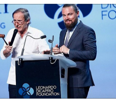
بنیاد لئوناردو دی کاپریو بازیگر مشهور هالیوودی اعلام کرد ۴۰ میلیون دلار دیگر برای کمک به حل مسایل محیط زیست اختصاص می دهد. مبلغی که بنیاد دی کاپریو در این زمینه هزینه می کند از حراج وسایل و اشیای لوکس در دوین حراج سالانه که به میزبانی دی کاپریو در سن تروپه برگزار شد، به بخشی از این مبلغ از اجرای دو کنسرت

انقراض موجودات شود. بنیاد دی کاپریو سال ۱۹۹۸ تاسیس شده و برای حمایت از اقیانوس ها، جنگل ها و تغییرات آب و هوایی و موجودات در معرض خطر تلاش می کند. دی کاپریو ۴۰ ساله در این مراسم گفت: ما جنگل ها، حیات وحش، رودخانه ها و اقیانوس ها را نابود می کنیم. همه اینها نه تنها چیزهای کلیدی این سیاره هستند بلکه زندگی را برای ما امکان پذیر می کنند. در این جشن چهره های برجسته ای چون برنس آلبرت دوم از موناکو، کیت هادسون، اورلاندو بلوم، ناتومی کمبل، آدرین برودی، ماریون کوتیاری، کریس تاگر و هایدی کلووم حضور داشتند. لئون جان و جان لچند در این برنامه اجراهای متفاوتی ارائه کردند. یک موسسه خیریه خصوصی سویسی و جورجیو آرمانی برگزار کنندگان این برنامه بودند.