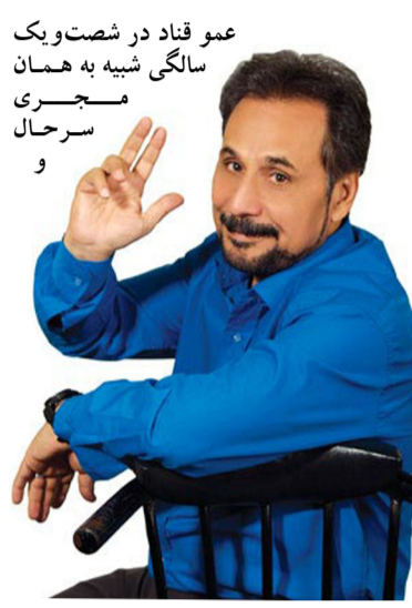
عمو قناد در شصت و یک سالگی شبیه به همان مجری سرحال و پرانزی ۳۰ سال پیش است. چهره طاهری مجید قناد در طول این سی سال عوض نشده تا جایی که همه از او می پرسند عموی عزیز! شما چرا هیچ وقت پیر نمی شوید.