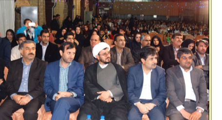
گرامیداشت روز پرستار

بهداشت و درمان به مرقد مطهر حضرت امام خمینی(ره) تهیه پرچم، پلاکارد و ریس به هزینه بالغ بر ۱۰ میلیون تومان جهت تجهیز تمامی مراکز تابعه به منظور گرامیداشت ایام الله دهه فجر - برگزاری اردوی دو روزه جهت پرسنل انتظامات