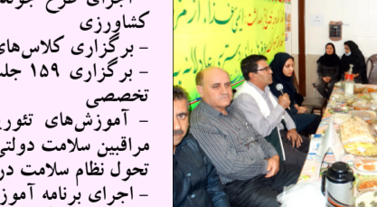
جشنواره غذای سالم مرکز شهید اسماعیلی

فعالیت های اجرایی حوزه بهداشت - انعقاد قرارداد واگذاری داروخانه مراکز بهداشتی درمانی دادین، سرمشهد، جره، بالاده، مهرانجان، کلانی، خشت و سیدحسین به بخش خصوصی - برپایی سه نمایشگاه: ۱- نمایشگاه هفته سلامت (در محل شبکه بهداشت و درمان) (درمان) ۲- نمایشگاه پویایی و بالندگی و جوانی جمعیت (در نگارخانه پرنبان اداره فرهنگ و ارشاد اسلامی) ۳- نمایشگاه پیشگیری از اعتیاد (در نمازخانه پارک آزادی) - اجرای ۱۲ جشنواره سفره غذای سالم با همکاری درون بخشی و برون بخشی و داوطلبان سلامت ادارات و محلات در طول هفته سلامت در سطح شهرستان - اجرای ۳ برنامه پیاده روی در هفته سلامت و هفته مبارزه با مواد مخدر در شهرکازرون و بخشهای تابعه