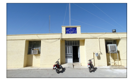
پایگاه سلامت خانواده الهدی