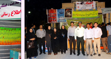
نمایشگاه پیشگیری از اعتیاد (پارک آزادی)