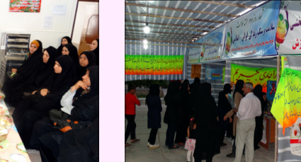
نمایشگاه هفته سلامت