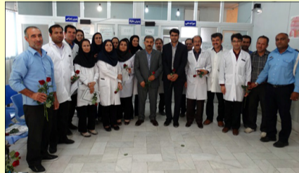
جشن گرامیداشت روز آزمایشگاه