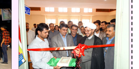
نمایشگاه پویایی، بالندگی و جوانی جمعیت