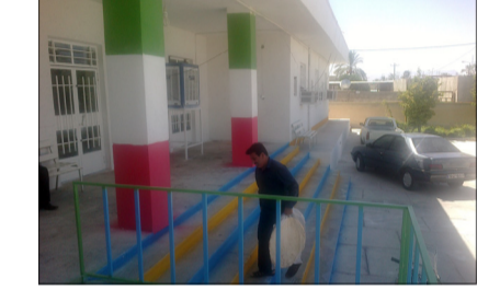
مرکز بهداشتی درمانی کنارخته

- اختصاص مبلغ ۵۰۰ میلیون تومان به بیمارستان امام سجاد خشت و کنارخته و مبلغ ۵۰۰ میلیون تومان به بیمارستان قائمیه با پیگیری نماینده محترم شهرستان کازرون از طریق وزارت بهداشت درمان آموزش پزشکی. - افتتاح مرکز سلامت جامعه شیخ ابوتراب با اعتباری بالغ بر ۱۳۰ میلیون تومان و تجهیز واحدهای دندانپزشکی و آزمایشگاه آن مرکز - مجوز بازسازی پایگاه سلامت شهری ابوسحاق اخذ گردیده و به محض تخصیص اعتبار اقدام به بازسازی خواهد شد. - احداث تسهیلات زایمانی بالاده و ۲ واحد ساختمان محل زیست پزشک با اعتبار ۵۰۰ میلیون تومان در حال واگذاری به پیمانکار است. - تکمیل پروژه های عمرانی مراکز بهداشتی درمانی سرمشهد و کلانی و ۵ واحد پاسیون با اعتبار بالغ بر ۲۷۰ میلیون تومان که در هفته دولت افتتاح خواهد شد. - تکمیل انبار دارویی جهت شبکه بهداشت و درمان با اعتبار ۱۴۰ میلیون تومان در محل آزمایشگاه بافرالعلوم. - احداث پارکینگ اختصاصی با اعتبار ۴۲ میلیون تومان و با ظرفیت ۲۴ ماشین جهت پرسنل شبکه بهداشت و درمان شهرستان کازرون - احداث پارکینگ اختصاصی برای مراکز بهداشتی درمانی سرمشهد، نرگسزار، کلانی و... - تعمیر و بازسازی نمازخانه شبکه بهداشت و درمان با اعتبار ۱۵ میلیون تومان