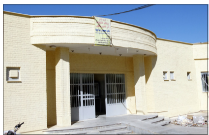
پایگاه سلامت خانواده سعدی

عملکرد حوزه عمرانی تعمیر و بازسازی مراکز بهداشتی درمانی خشت، کنارخته، نودان، سید حسین (مرکز محیط زیست پزشکی)، و پایگاه های سلامت خانواده الهدی، سعدی، شهید اسماعیلی و مرکز سلامت جامعه قائمیه با صرف هزینه ای بالغ بر ۳۰۰ میلیون تومان