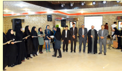
گرامیداشت روز ماما