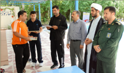
اردوی پرسنل انتظامات شبکه