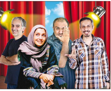
پاییز ۹۴ در شبکه سه سیما با «خانم و آقای سنگی» آغاز می‌شود، با «آسمان من» ادامه می‌یابد و پس از ماه‌های محرم و صفر به «در حاشیه ۲» مهران مدیری می‌رسد. برنامه «۳ شو» نیز جمع طنز و کمدین‌ها را در این شبکه کامل می‌کند.