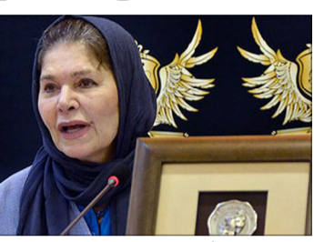
هما روستا بازیگر با سابقه و مطرح سینما و تئاتر ایران بعد از مبارزه‌ای چندین ساله با

گویا علاوه بر مردم عادی، بازیگران هم دنبال شغل دوم هستند و برخی از آنها در مشاغل غیر هنری مشغول هستند. دو شغل‌های ایران کم نیستند. افراد معروف و مشهور هم از این قاعده مستثنا نیستند. جالب است بدانید که خیلی از بازیگران برای خود شغل دومی دست و پا کرده‌اند. شهاب حسینی بازیگر محبوب و مشهور سینمای ایران را به ندرت می‌توان پیدا کرد مگر ایامی که از سر فیلمبرداری می‌آید. او حسابی سرش شلوغ است. جالب است بدانید که آقای حسینی کافه ای را به راه انداخته به اسم «کافه هنر» که با توفق اکثر بازیگران است.