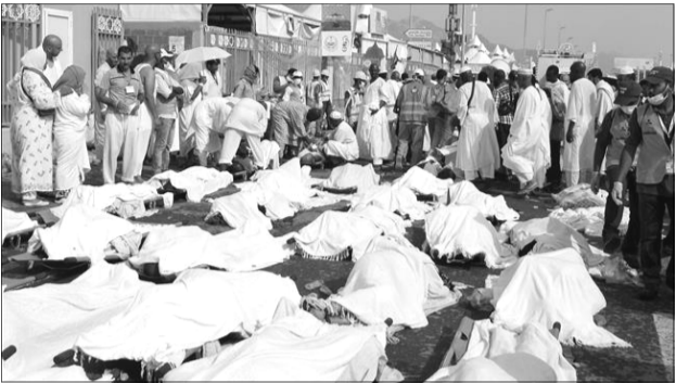
حجاج در ترمینال حج

مقابل مهرورزی و لطف و دوستی که ایرانی‌ها از آن برخوردارند و مهرنازداران خانه‌خداینند، نیاید و حرمت‌ها و جور و جفای کسانی را تحمل کرد که نیاز به پاسخی دندان شکن و محکم دارند و این پاسخ، نه با جنگ و لشکرکشی، که باید با سیاست و یقینا ما نیاز به پرداخت هزینه‌هایی در این راه داریم. متأسفانه برخی در ایران و در این صنعت، به دنبال درآمد سرشارشان هستند و شاید بخشی از مشکلات در سفرهای زیارتی مردم مشتاق به عربستان، ناشی از عملکرد ضعیف آنان باشد. چرا که بارها و بارها بسیاری از اصحاب رسانه و حتی شماری از زوار، از برخورد های غیرانسانی و غیراخلاقی در هواپیمای اجاره‌ای سعودی‌ها در فرودگاه‌های عربستان و حتی در شهرها و مکان‌های دیگر، شکوه و گله کرده‌اند. اما نادیده گرفتن‌ها و ناچیز شمردن‌ها باعث افزایش معضلات و مشکلات گردیده است. لذا می‌طلبید و خوب است سازمان حج و زیارت و مردم شریف و بزرگوار نسبت به سفر به سرزمین وحی تا زمانی که دولت عربستان، شفاف سازی نکرده است و در مقابل جان باختگان و خانواده‌های داغدارشان اقدام قابل قبول و قانونی و انسانی و اسلامی به عمل نیاورده است تجدید نظر کنند.