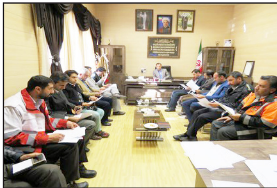
گردید و دستگاههای مرتبط، گزارش عملکرد خود را اعلام نمودند.