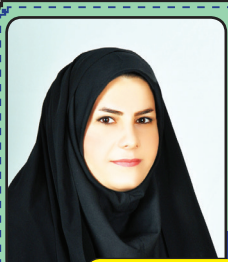
منتظر داستان و اشعار شما هستیم

یک جمجمه در سکوت شب می رقصید ای کاش کسی به مرگ پایان می داد