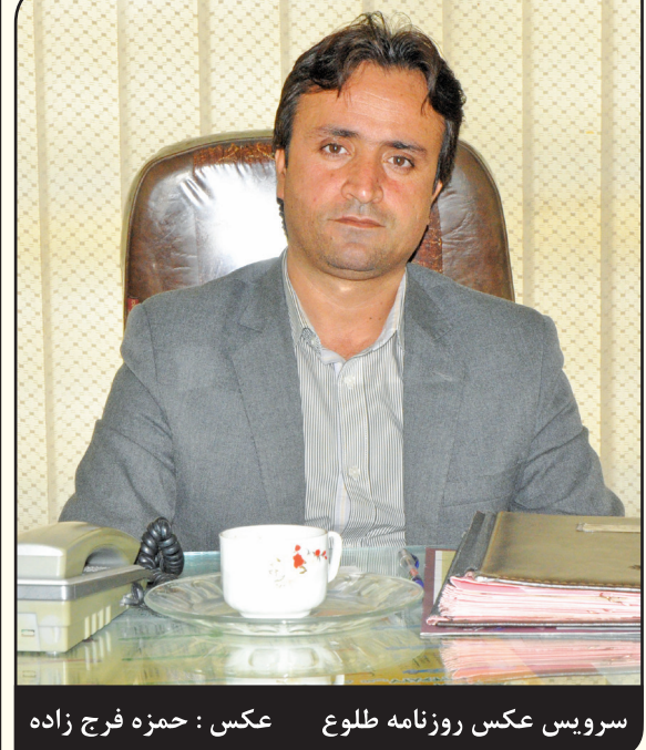
سرویس عکس روزنامه طلوع

فرهیختگان، صاحبان قلم و انسانهای برجسته و وارسته ای که بتوان از دریای علم و هنر و معرفت آنها بهره مند شد و این فرهنگ و معرفت و بینش عمیق را که دستاورد تاریخی غنی از دوران طلایی است و قدمتی به بلندای تاریخ دارد که می بایست اکنون مرزهای فرهنگی و هنری را به زیر سایه خود آورد و شعار همدلی و همبستگی را سرلوحه کار خویش گرداند.