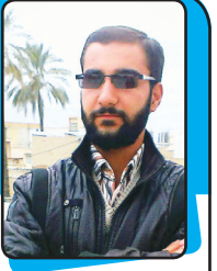
گزارش: محمدرضا نوکام