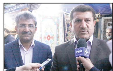
معاون اداری و مالی شهرداری شیراز خبر داد: