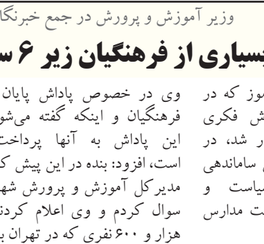
مدیرکل آموزش و پرورش در جمع خبرنگاران، اعلام کرد