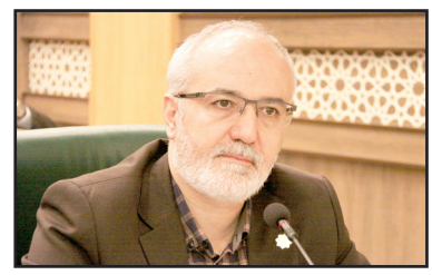
معاون اداری و مالی شهرداری شیراز خبر داد: