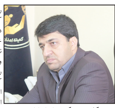
مدیرکل جدید کمیته امداد امام خمینی(ره) استان فارس در مراسم تودیع و معارفه مدیران کل این نهاد ضمن قلدردانی از اعتماد رسیدن به نقطه مطلوب، فرسنگ می‌شوند.