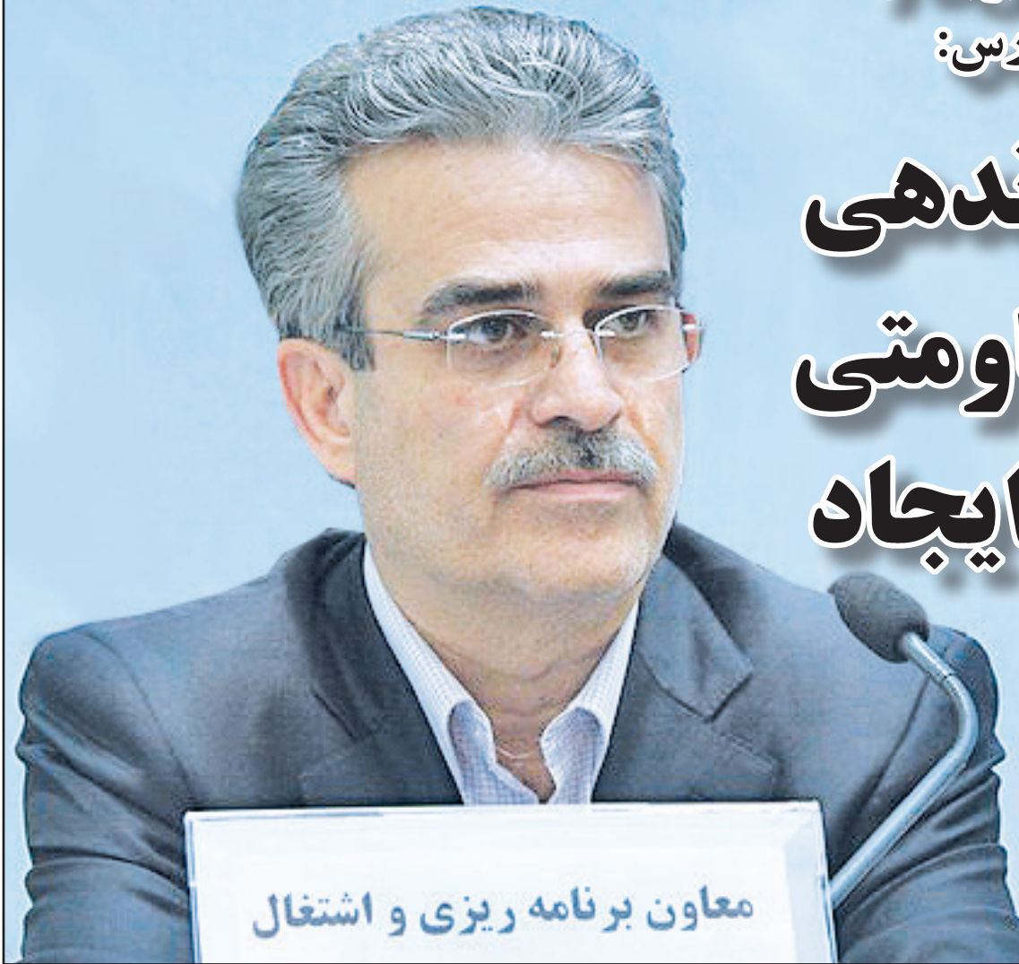
معاون برنامه ریزی و اشتغال