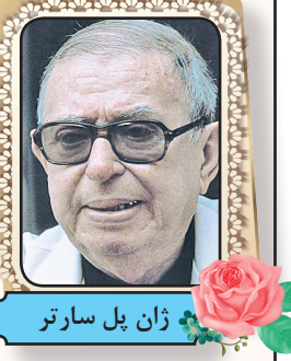
ژان پل سارتور

ژان پل سارتور در ۲۱ ژوئن سال ۱۹۰۵ در پاریس متولد شد. او یکی از پیشگامان مکتب اگزیستانسیالیسم بود که از چپ‌گرایان فرانسه و دیگر کشورها دفاع می‌کرد. سارتور کتاب‌های زیادی نوشت که از جمله آن‌ها می‌توان به کتاب تأثیرگذار «هستی و نیستی» اشاره نمود. سارتور در سال ۱۹۶۴ برای نگارش کتاب «کلمات» برنده جایزه نوبل ادبی شد ولی از پذیرفتن این جایزه خودداری نمود. او در طول زندگی خود با سیمون دوبوار فیلسوف، نویسنده و فمینیست فرانسوی همراه و همدم بود. ژان پل سارتور فیلسوف و منتقد فرانسوی و از پیشگامان مکتب اگزیستانسیالیسم و نویسنده کتاب‌هایی نظیر تهوع، مگس‌ها، هستی و نیستی و کلمات بود.