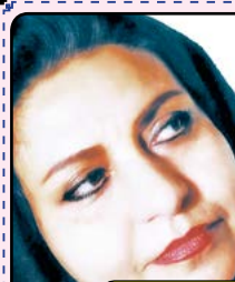
منتظر داستان و اشعار شما هستیم

لطفا مطالب خود را با درج شماره تلفن به دفتر روزنامه یا آدرس الکترونیکی ذیل ارسال نمایند. ضمناً روزنامه در ویرایش مطالب ارسالی، آزاد است و مطالب ارسالی برگشت داده نمی شود. ava.rezaei@tolounews.com