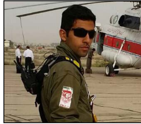
احمر استان فارس

این خاطره مربوط می شود به یک عملیات جستجو و نجات در منطقه فرابنده به سمت جم و بندر دیر؛ طی گزارش اولیه حادثه اعلام شد یک جوان ۲۸ ساله اصفهانی در این منطقه گم شده است. بلافاصله به عنوان تیم جستجو و نجات سگ های تجسس (آنتست) به منطقه اعزام شدیم.