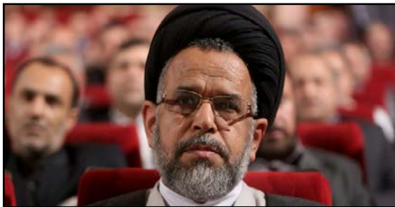
حجت الاسلام سید محمود علوی در جمع مردم شهرستان رابر از

توابع استان کرمان با تاکید بر اینکه دولت یازدهم دولتی جناحی نیست اظهار کرد: این دولت جناح نمی شناسد بلکه ملتی سربلند و اسلامی می شناسد. به گزارش مهر، وزیر اطلاعات گفت: این دولت به دنبال فراهم کردن زمینه اشتغال در جامعه است و می خواهد از نیروهای مستعد و کارآمد جامعه استفاده کند. وی با اشاره به اینکه اقتصاد و امنیت لازمه جامعه پویا هستند تصریح کرد: این خواسته مقام معظم رهبری در قالب شعار سال ۹۵ در سایه وحدت و همدلی محقق می شود. وزیر اطلاعات خاطرنشان کرد: دولت تدبیر و امید به دنبال آرامش و نظم در جامعه است و به همه آحاد ملت احترام می گذارد.