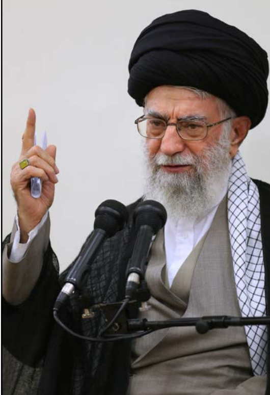
رهبر انقلاب در پیامی خطاب به نمایندگان تاکید کردند:

اقتصاد مقاوم و فرهنگ اسلامی، دو اولویت فوری