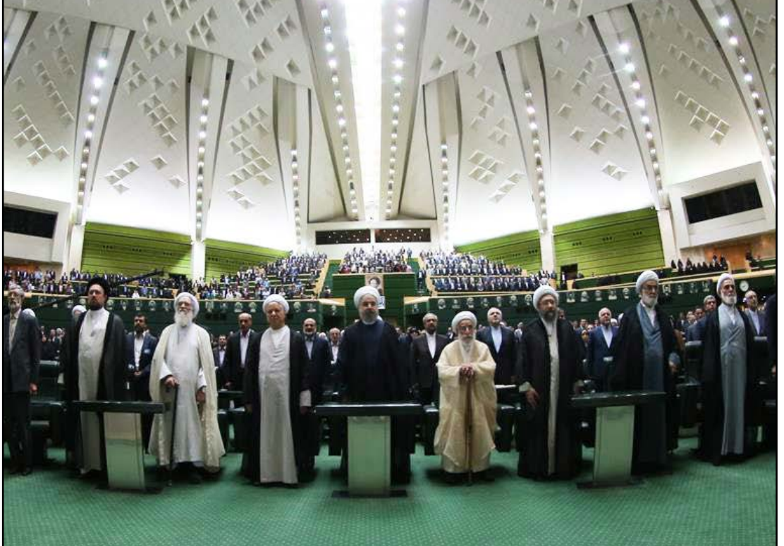
با حضور مقامات کشوری و لشگری؛