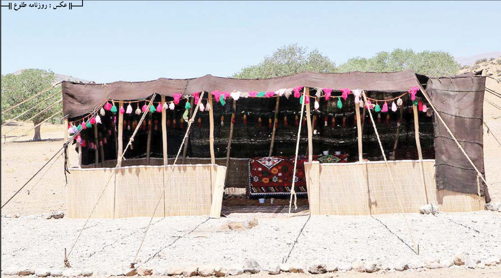
گزارش اختصاصی روزنامه طلوع؛