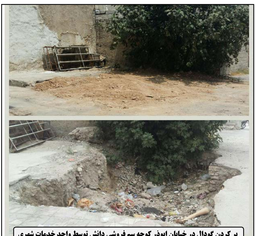
پر کردن کودال در خیابان ابودر کوجه سم فروشی دانش توسط واحد خدمات شهری

مطالب این بخش توسط روابط عمومی شهرداری و شورای اسلامی شهر کازرون تهیه و تنظیم شده است.