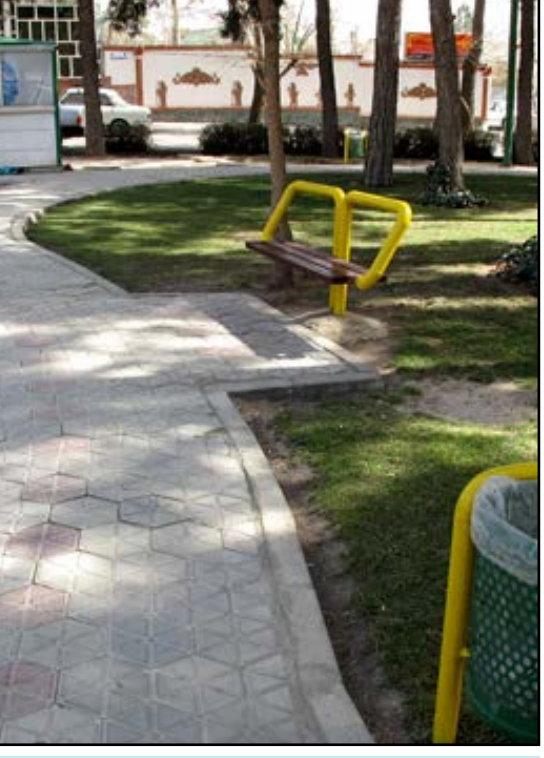
مطالب این بخش توسط روابط عمومی شهرداری و شورای اسلامی شهر کازرون تهیه و تنظیم شده است.