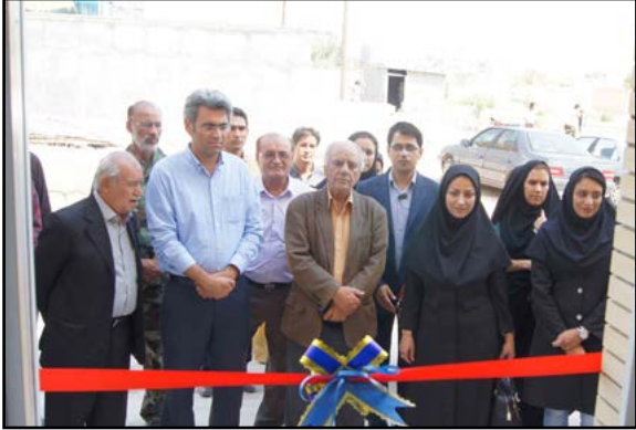
فارس بیشتر حمایت شود.

کتابخانه مرکزی لارستان از سال ۱۳۸۸ به همت اداره کل راه و شهرسازی لارستان ساخته شده است. این کتابخانه با زیربنای سه هزار متر مربع تاکنون بیش از ۶۰ درصد پیشرفت فیزیکی داشته است و بودجه آن نیز از اعتبارات تملک دارایی های سرمایه ای تامین می شود.