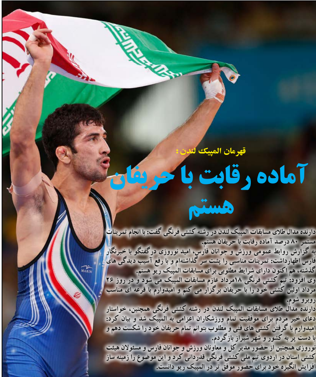
قهرمان المپیک لندن: