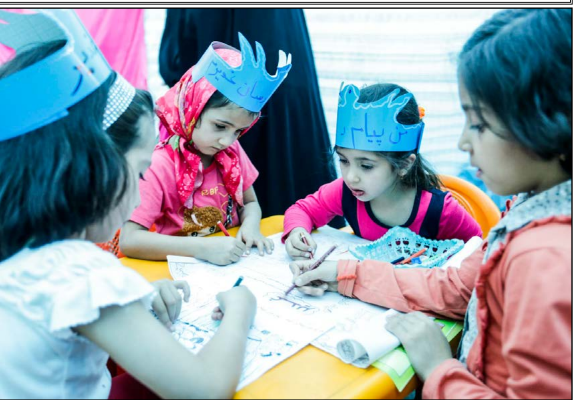
من پیام رسان غدیرم نمایشگاه غدیر در حرم شاهچراغ