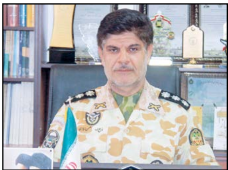
سر ویس خیری / نصرالله پناهی:

اسلامی کرد و بلافاصله ۳ روز قبل از جنگ تحمیلی به سوی مناطق عملیاتی غرب و جنوب غرب اعزام شد. برابر منویات مقام معظم رهبری گسیل تیپ ۵۵ هوابرد شیراز به جبهه های جنوب، دل مسئولین نظام را خرسند کرد. وی افزود: تیپ ۵۵ هوابرد در دوران ۸ سال دفاع مقدس تقریباً در تمامی عملیاتی بزرگ شرکت داشته و عمدتاً به عنوان یگان خط شکن در نوک پیکان عملیاتها نقش تعیین‌کننده و کلیدی خود را ایفا کرده است. در طول ۸ سال دفاع مقدس بیش از ۶۰ هزار رزمنده از طریق این تیپ به جبهه‌های جنگ حقیقت علیه باطل اعزام شدند. از جمله عملیاتی بزرگی که این تیپ نقش موثر و تعیین‌کننده‌ای در آن داشته است به ترتیب ثامن‌الائمه، طریق القدس، فتح‌المبین، بیت المقدس، والفجرها، کربلاها، مسلم بن عقیل، عاشور، قادر، بدر، الله اکبر، خیبر، عاشورا، حاج عمران، مرصاد و... هستند. تیپ ۵۵ هوابرد ۱۴ ماه قبل از شروع