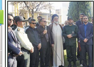
ادامه مطلب در پایین همین صفحه ...

در پایان این مراسم، تندیس جانباز توسط جناب هدایت جانباز سرافراز جنگ هشت سال دفاع مقدس، معاون فرمانداری و دو تن از جانبازان دیگر