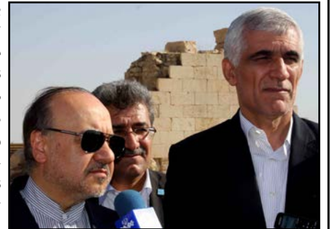
سرویس خبری / داود کشاورز - علی گلچین: رئیس سازمان میراث فرهنگی و گردشگری کشور در سفر به استان فارس و شهرستان کازرون گفت: برای مرمت و بازسازی آثار تاریخی نیازمند مشارکت بخش خصوصی هستیم.

کار کاوش مجموعه تاریخی بیشاپور ده ها سال زمان نیاز دارد