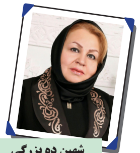
شهین ده بزگی