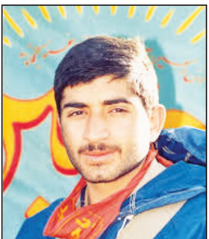
معلم شهید مصطفی دیبانی نسب