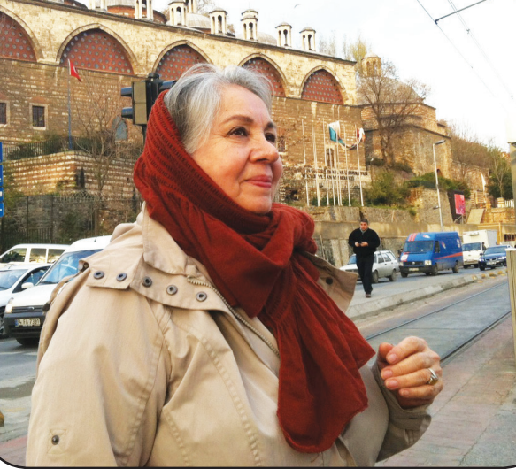
با این دیدگاه، زندگی کردن چقدر بستگی به محیط دارد که افراد در آن متولد شده و رشد می کنند؟

می رسد که مردم به او بدهکار نبینند. او از کسی طلبکار نیست. همین اصل باعث می شود آدمها مهربان تر شوند. خداوند هر کسی را با انرژی و مختصات ویژه ای آفریده است. هر آدمی خلق شده تا در دنیا کاری انجام دهد. وقتی بدانی خدا چرا تو را آفریده، مهربان می شوی. البته این مهربانی تا زمانی ادامه پیدا می کند که نتیجه عکس از این رفتار، نگیری و دلسرد نشوی اما با همه اینها معتقدم بازتاب رفتار و گفتار ما به خودمان برمی گردد. دلخوری ها و طلبکاری ها و... خودمان را بیشتر اذیت می کند. واقعیت این است که ما به دنیا آمده ایم تا درست زندگی کرده و از آن مراقبت کنیم.