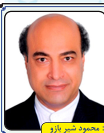
منتظر داستان و اشعار شمایستیم

لطفا مطالب خود را با درج شماره تلفن به دفتر روزنامه یا آدرس الکترونیکی ذیل ارسال نمایید. ضمناً روزنامه در ویرایش مطالب ارسال، آزاد است و مطالب ارسالی برگشت داده نمی‌شود. tolou.news@yahoo.com