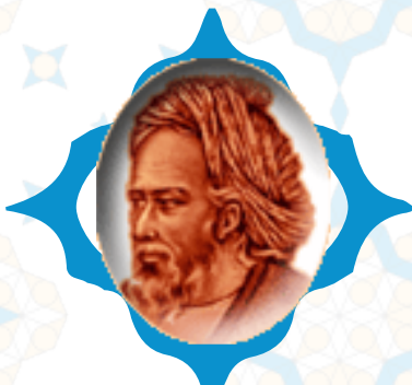
ابوسعید ابو الخیر

حاله عالم سر به سر پرسیدم از فرزانه‌های گفت: یا خاکی است، یا بادی است، یا افسانه‌های گفتمش: آن کس که او اندر طلب پویان بود! گفت: یا کوری است، یا کز بسته، یا دیوانه‌های گفتمش: احوال عمر ما چه باشد؟ عمر چیست؟ گفت: یا برقی است، یا شمعی است، یا پرورانه‌ای بر مثال قطره‌ی برف است در فصل تموز هیچ عاقل در چنین جاگاه سازد خانه‌ای! یا مثال سیل خانه است آن در فصل بهار هیچ زیرک در چنین منزل نشاند دانه‌ای! فیلسوفی گفت اندر جانب هندوستان: