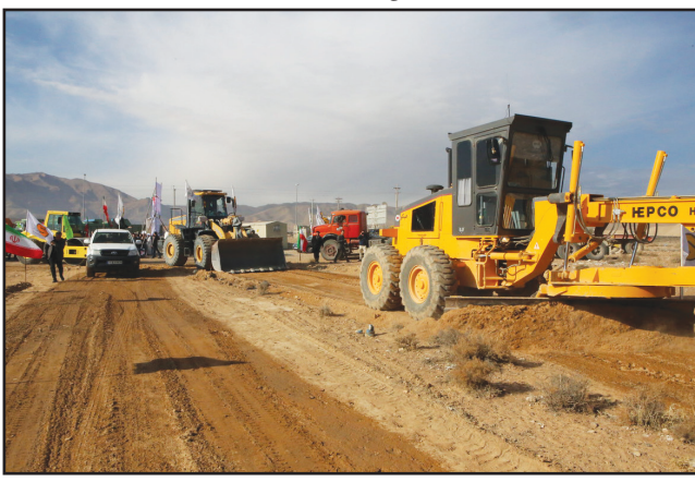
حیات های عبور می کند و در آینده نیز مجتمع های خوب بین راهی در این مسیر احداث خواهد شد که جانمایی برخی مشخص شده و امیدواریم همزمان با اجرای پروژه ساخت این مجتمع هم ها آغاز شود تا همزمان با افتتاح آزاده راه به مردم خدمات ارائه دهند.

استاندار فارس، با اشاره به توجه ویژه وزیر راه و شهرسازی به تامین مالی این پروژه گفت: مجموعه حمایت های انجام شده منجر به این شد که پروژه آزاد راه شیراز- اصفهان طی یک سال گذشته معادل چند سال قبل پیشرفت فیزیکی داشته باشد. وی بیان کرد: در مکاتبه ای که با وزیر راه و شهرسازی داشتم تقاضای حمایت از اجرای این