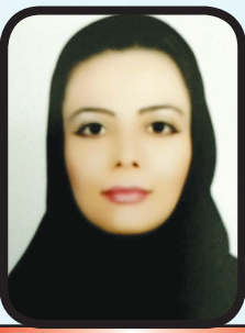
مرفیبه اسکروچی (شماستیم)

ماهی قمرحوض، میرقصه باخیالت دلش میخواد که اسمش، بیفته توی فالت تو رویاهاش همیشه، حس میکنه هوتو به گوشه ساکت میشه تا بشنوه صداتو گاهی دلش میگیره از خاطرات دیروز از اون همه فاصله از این جهان پرسوز داشتن تو یه رویاست، باقی قصه سرده از اینجا تا رسیدن ذره به ذره درده غربت و انتظاری که لحظه لحظه داغ بغض ته نگاهت نشونه ی فراقه بادت باشه که ماهی بدون آب می میره تو مثل دریایی و تو وسعت اسیره بذار تو خلوت دل بباره ناز بارون لالایی قصه رو عاشق تر از شب بخون