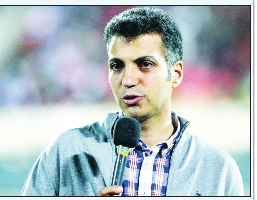
یکی از اعضای مرکز نظارت و ارزیابی سازمان صداوسیما از تذکر به «عادل فردوسی پور» به خاطر سخنان اخیرش درباره پلاسکو در برنامه تلویزیونی نود خبر داد.