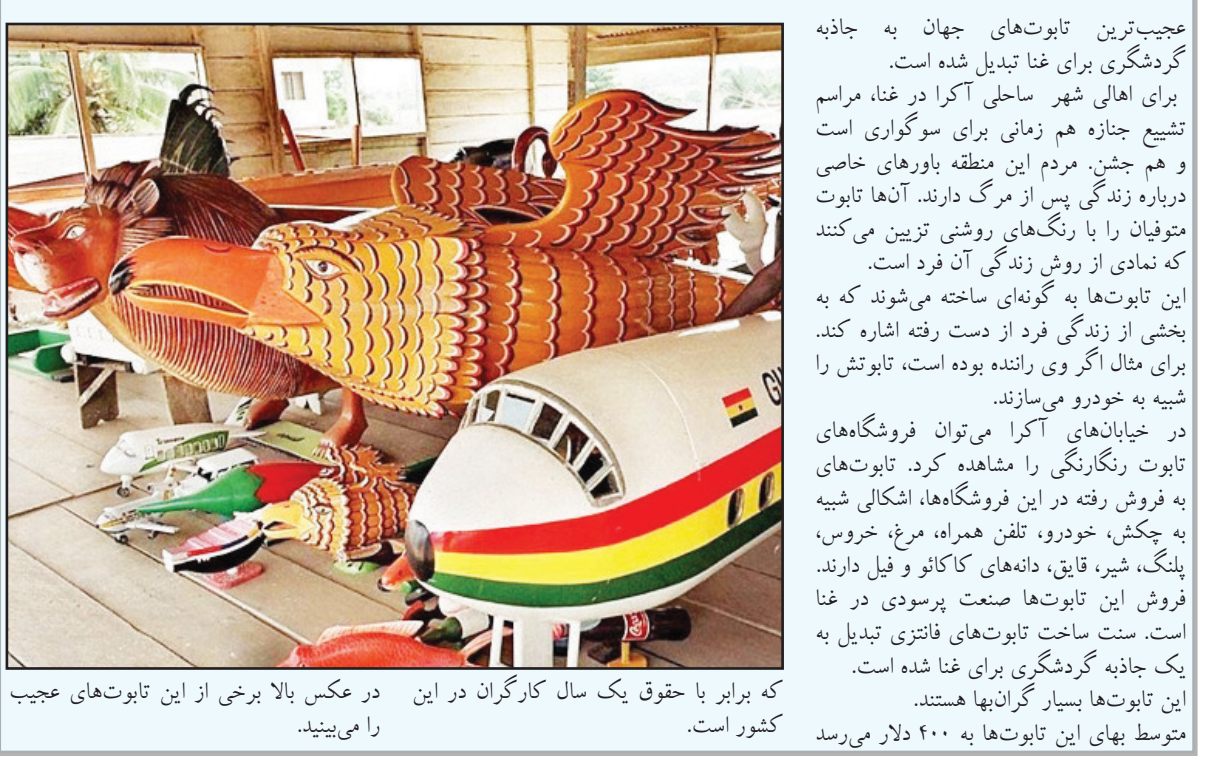
که برابر با حقوق یک سال کارگران در این در عکس بالا برخی از این تابوت های عجیب کشور است. متوسط بهای این تابوت ها به ۴۰۰ دلار می رسد