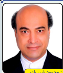
منتظر داستان و اشعار شما هستیم

این چه مهربیست به لب، شبه قیامت داری؟! وین چه مهربیست به دل، مثل کلامت داری؟! من به گرمای وجودت، چه ارادت دارم تو به مهر ماه دلم، خوب زعامت داری من که با صورت ماهت، دل خود خوش دارم تو به لطف و کرمت، حق کرامت داری من به فرمان دلم، چونکه تو سلطان دلی کس چنین ویژه نباشد، که تمامت داری من که با عمق وجود، با تو رفاقت دارم تو به مهر ماه دلم، قصد اقامت داری!؟