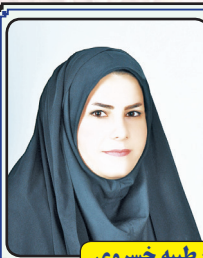
منتظر داستان و اشعار شما هستیم

ای طلوع، ای زیبایی مطلق، گل های لاله را خروار خروار تقدیم قدمت خواهم کرد آن زمان که قدم رنجه کنی و مهمان ابدی دلم شوی!