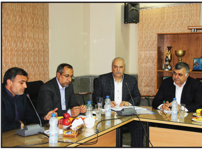
در جلسه ای با حضور نماینده لارستان، خنج و گراش و نماینده مردم بندرعباس و نیز مدیران کل

راه و شهرسازی لارستان و هرمزگان، راه‌های مواصلاتی حوزه لارستان با هرمزگان مورد بررسی و ارزیابی قرار گرفت. به گزارش روابط عمومی اداره کل راه و شهرسازی لارستان، جلسه‌ای با موضوع بررسی راه‌های مشترک استان هرمزگان با حوزه استحقاقی اداره کل راه و شهرسازی لارستان درخصوص احداث آزاد راه لار به بندرعباس، تکمیل جاده‌ی لاریه بستک و بندرعباس راه بندرعباس به ایستگاه آه آهن زاهدحمود تشکیل شد و موارد فوق به تفصیل مورد ارزیابی قرار گرفت. در این جلسه پس از بحث و گفتگوها مقرر شد درخصوص آزاد راه لارستان به کپورستان از طریق پیگیری مشترک نمایندگان لارستان و بندرعباس و مدیران کل راه و شهرسازی در جلسه‌ای باحضور دکترخادمی و مهندس محفوظی معاونین وزیر راه و شهرسازی، نسبت به تسریع دراحداث باند دوم یا آزادراه لار-کپورستان تصمیمات مقتضی اتخاذ گردد و اداره کل راه و شهرسازی هرمزگان راه اتصال ایستگاه زاهدحمود به اتوبان سیرجان _ بندرعباس درسال ۹۶ را به اتمام برساند.