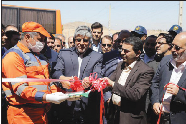
با حضور شهردار

افزایش تعداد باغ های خانواده تا پایان سال جاری