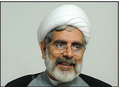
دبیر کمیته انتخابات شورای هماهنگی حصر و انتخابات صحبت کردیم. رهمای انتشار مشروح این دیدار را به بعد از زمان ثبت‌نام انتخابات حجت‌الاسلام محسن رهمای در

گفت‌وگو با «ایلنا» تصریح کرد: در ادامه دیدارهای گذشته‌مان، روز چهارشنبه هفته گذشته به همراه آقای منتجب‌نیا به دیدار مقام معظم رهبری رفتم. او ادامه داد: در این دیدار درباره موضوعات مهمی از جمله رفع حصر و انتخابات صحبت کردیم. رهمای انتشار مشروح این دیدار را به بعد از زمان ثبت‌نام انتخابات حجت‌الاسلام محسن رهمای در دبیر کمیته انتخابات شورای هماهنگی حصر و انتخابات صحبت کردیم. رهمای انتشار مشروح این دیدار را به بعد از زمان ثبت‌نام انتخابات حجت‌الاسلام محسن رهمای در