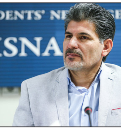
مدیرکل برنامه و بودجه وزارت آموزش و پرورش با بیان اینکه منتظر ابلاغ قانون برنامه ششم توسعه به دستگا‌های اجرایی هستیم گفت: پس از آن راهکارهای در نظر گرفته شده را در قالب لایحه‌ای تنظیم و به هیئت دولت ارسال می‌کنیم که پس از تصویب دولت و مجلس قابلیت اجرایی پیدا خواهد کرد.

وی در پاسخ به اینکه آیا اجرای این نظام موازی طرح رتبه‌بندی معلمان نیست؟ اظهار کرد: طرح رتبه بندی معلمان، نظام پرداخت حقوق نیست بلکه یک فوق العاده خاص بود برخی بندهای برنامه پنجم به دستگاها اجازه داده بودند فوق‌العاده‌هایی منظور شود که تکمیلی و کمک کننده احکام بود.