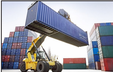
نایب رئیس اتاق بازرگانی شیراز گفت: با توجه به تغییر ساختار تولید، کشورهای آفریقای می توانند

وی ادامه داد: برای رسیدن به صادرات بیشتر کشورهای آفریقای فرصت بسیار مهم و بزرگی است که باید از آنها استفاده شود.