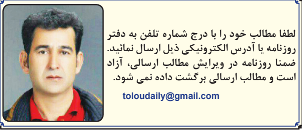
لطفا مطالب خود را با درج شماره تلفن به دفتر روزنامه یا آدرس الکترونیکی ذیل ارسال نمایید. ضمنا روزنامه در وبپایش مطلب ارسالی، آزاد است و مطالب ارسالی برگشت داده نمی شود. tooldaily@gmail.com

تو آتقدر به وجاهت از او نشان ببری که یک کرشمه تو را بس ز جان امان ببری مرا چو پیش وجودت نمانده عرض وجود ز سینه شعله ی جانم بر آسمان ببری چنان بروی تو مبهوتم از هنر مندیش که ذکر احسن از این لب از این دهان ببری هزار تشنه آبش به چشمه خواهی برد به خانه تشنه تر از من یکان یکان ببری چنان به وجهی خود در جهان میندش دل کزین عجزه گمانم که خود گمان ببری یک از هزار وجهی حوا به کل عالم داد تو را بگویم از این جلوه کل آن ببری کجاست صورت حوا چه گشته یوسف مصر! مگر سیرت زیباست که تو امان ببری دلم رضا نشود گر نگویمت ای دوست چو پند آیه نبوئی دل از جهان ببری