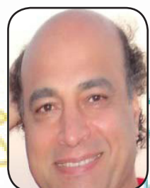
مترجم: محمود شیرازی