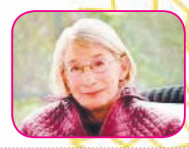
مرک امیر آمریکا

ما گمشدگانی در این جهان هستیم با یأس‌ها و شادی‌های فراوان، با امیدها و نومی‌های فراوان، گاه چهره‌هایمان سراپا شور است، اگر شعر یا آهنگی بتواند تمام ذرات بدن ما را تحت تأثیر قرار دهد و گاه خلوت‌های یأس‌آلود و احساس اینکه همه در این جهان بی‌پناهم، سخت به سراغمان می‌آید. نخستین شعر جلد دوم کتاب «بودنت» تمام احساسات ذکر شده را ایجاد می‌کند. شعری از مری الیور که شاعری است اهل آمریکا متولد سپتامبر ۱۹۳۵. در این شعر که غازه‌های سفید نام دارد، شاعر با نگاه خاکستری به زندگی انسان و توانایی‌ها و ناتوانی‌هایش، روایت‌کننده سهمی است که هر انسانی از زندگی در این دنیا نصیبش می‌شود؛ سهم ما از یأس، سهم ما از طبیعت و زیبایی‌هایش، سهم ما از صدای جهان که شاعر انعکاس آن صدا را در گلوئی غازه‌های وحشی می‌شنود.