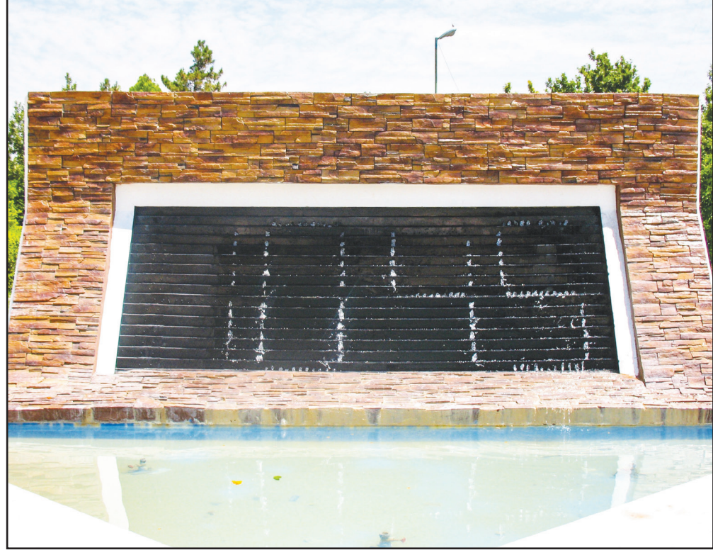
شرح روزی روزگاری شیراز (چهارراه خلدبرین)