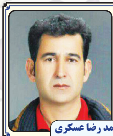
منتظر داستان و اشعار شما هستیم

من از موندن دارم میگم تو حرفت رفتن از اینجاست تو چشمت راستشو میگن این از رخسار تو پیدا است نه مستی می کند چاره نه گریه می دهد تسکین بیا دستم بگیر امشب که امیدم به اون دست هاست خدا با ما همینجا زیر این سقفه نمیدانم چه کس گفته خداوند یکه و تنهاس همه دنیا به من دادند نمی ارزه بدون تو اگه از تو جدا باشم برام بی رنگ و بی معناست