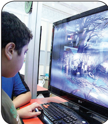
(جهاد دانشگاهی سابق) واقع در خیابان ساحلی غربی برگزار می شود.

نخستین همایش و نمایشگاه بازی های رایانه ای جنوب کشور به میزبانی شیراز برگزار می شود. به گزارش خبرنگار مهر، نخستین همایش و نمایشگاه بازی های رایانه ای جنوب کشور با هدف تبیین تقویت و ترویج مبانی فرهنگی و هویت اسلامی - ایرانی از طریق این صنعت با نگاه ویژه به کودکان و نوجوانان، شناسایی ظرفیت های موجود این صنعت در کشور و علی الخصوص استان فارس با رویکرد بومی سازی و تقویت تولیدات داخلی، شناسایی ظرفیت های فرآیند تولید، تأمین، واردات، صادرات، آماده سازی، تکثیر و توزیع انواع بازی های ویدیویی و رایانه ای، شناسایی و تلاش در جهت تولید و تأمین دانش فنی و نیز امکانات و تجهیزات وابسته به آن در تمامی حوزه ها و قالب متفاوت سخت افزاری و نرم افزاری، شناسایی و ایجاد زمینه برای رشد و شکوفایی خلاقیت های جوانان در صنعت سرگرمی و بازی و استفاده از ظرفیت های داخلی و خارج از کشور به منظور رشد و ارتقا صنعت بازی های ویدیویی و رایانه ای در