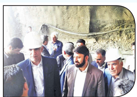
ماه به پایان خواهد رسید.