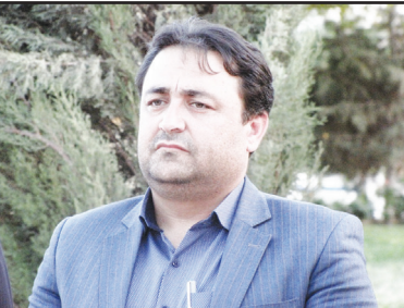
تردد خودروها، ایمنی در تردد شهروندان و رسیدن به استانداردهای مطلوب شهرداری است.