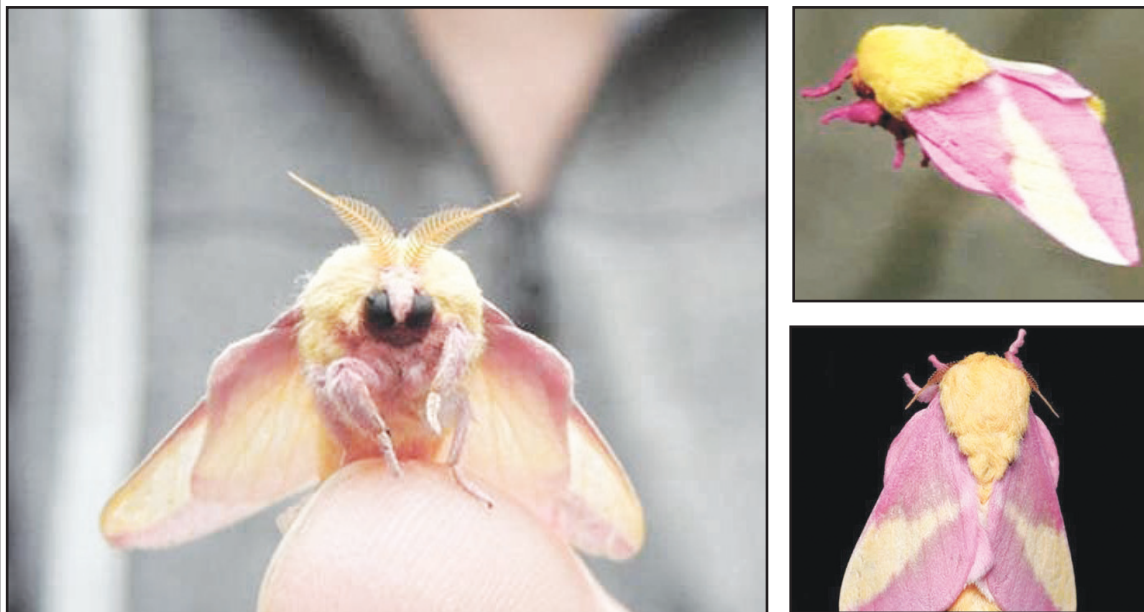
شب پره رز مانند درخت افرا (Rosy Maple Dryocampa rubicunda) با نام علمی یک گونه شب‌پره آمریکای شمالی و از خانواده شاپرکان چشم‌گرم‌بای این شاپرک صورتی و قرمز است. این شب است. بال آنها بین ۱.۵ تا ۲ اینچ طول دارد. پره‌ها زمانی که گرم هستند از درخت افرا به گزارش جام جم آنلاین، پاها و شاخک‌های تغذیه می‌کنند.