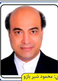
منتظر داستان و شمار شما هستیم

راه رفته، راه رفته، راه ناهموار بود پای ام‌ها، رفتن از این راه را ناچار بود پشت هر کوه کبود و دامن هر خاکریز چشم آشناک گریگ آدم‌خوار بود خواب ای بیدار لیکن در فصول درها دایره در دایره یک مار چون صد مار بود می‌سرودم رنج را در مصرع سنگین عشق آب می‌شد، دود می‌شد، آه آفتاب بود بی هراس از هر ملامتی، بی هراس از وهم شب می‌گشودم روی دل دیدار با دیوار بود هر پگاهی، هر سلاخ تازمانی در صبح نور مثل شب غمگین و پرسشگر و یا تب دار بود ناگهان از دور دست بیشه‌ی اندیشه‌ها یک صد برخاست چون پژواک یک هشدار بود کای به دور از باور شیرین عزت‌های صبر کی تو را گنته‌ست حتی یک گلی بی خار بود! آنچه داری و آنچه رفته و آنچه در برنامه است چشم به دور از نیم رحمتش سرشار بود تو که هستی؟ تو چه هستی؟ کی غزلبار را سرود؟ تو نمی‌بودی چه بهتر، بهترت بسیار بود!