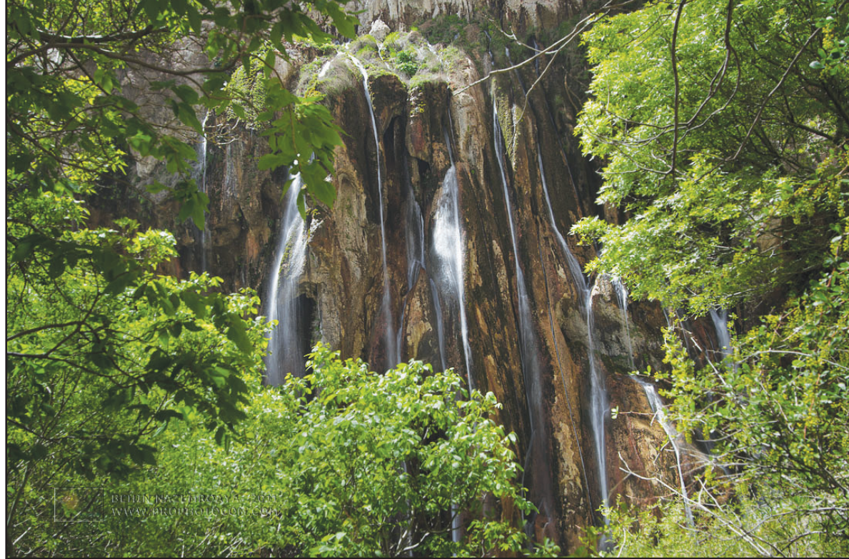
آبشار زیبای مارگون در استان فارس، ایران. این آبشار با ۱۰۰ متر ارتفاع و ۱۰۰ متر عرض، یکی از بزرگ‌ترین آبشارهای ایران است.